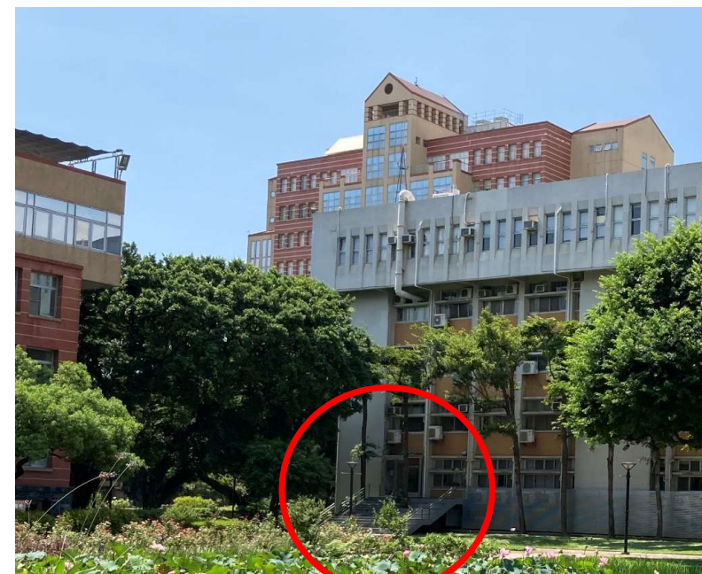
資電館一樓(商學大樓對面大樓) 註冊課務組