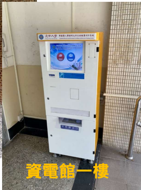
資電館一樓 (悠遊卡)