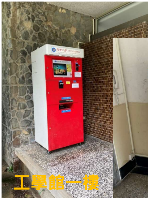
工學館一樓 (現金/悠遊卡)